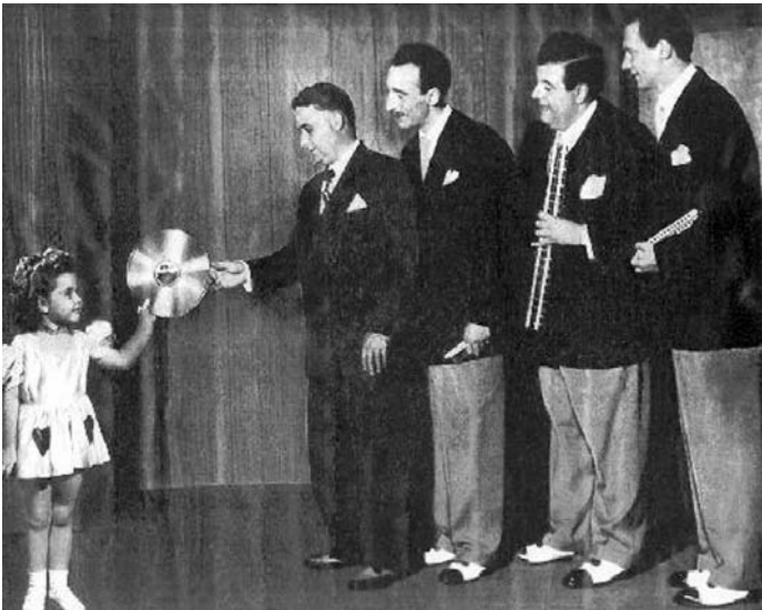
Abb. 6: Die Harmonicats erhalten ihre goldene Schallplatte.

Über künstliche Räume, Filter, Pegelkompression und viele andere Verfahren der Signalverarbeitung, deren auch nur cursorische Behandlung diesen Beitrag sprengen würde und auf die in anderen Publikationen ausführlich eingegangen wird, 17 führt der Weg in die spezifische Praxis der digitalen Medien, von denen hier nur ein aktuelles Gestaltungskonzept exemplarisch erwähnt werden soll. Digitale Schriften erlauben über die Arbitrarität und Adressierbarkeit ihres Codes hinaus das Rechnen und Programmieren. Die Schrift selbst wird ausführbar – ähnlich den Lochstreifen und -scheiben der Musikautomaten – jedoch nun auch als Teil algorithmischer Verarbeitung sowohl von Daten zur Klangerzeugung durch Synthesizer und Sampler wie auch der Audiodaten digitalisierter Phonographie.