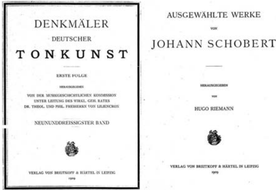
Abb. 2: Denkmäler deutscher Tonkunst, Titelblätter Bd. 39.

tierung, Schichtungen, Arrangements und Ähnliches festgehalten sind (vgl. Abb. 3).